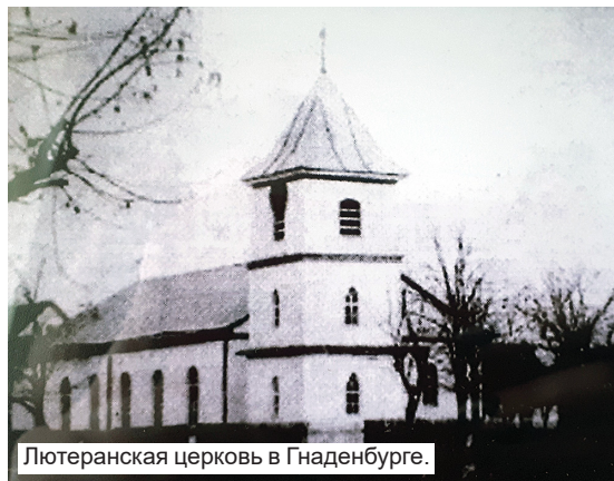
Лютеранская церковь в Гнаденбурге.

«Это черепичный завод, – тут же комментирует он, – а метров через 150-200 стоял кирпичный завод, где кирпич обжигали по уникальной технологии, и единица прочности была очень высокой. Прошло сто лет, а этот кирпич и сейчас с большим трудом удаётся разбить. В 20-х годах немцам прислали двигатель внутреннего сгорания, и они построили мельницу. Зерно туда возили со всей округи. Говорят, мука получалась высочайшего качества. И хотя