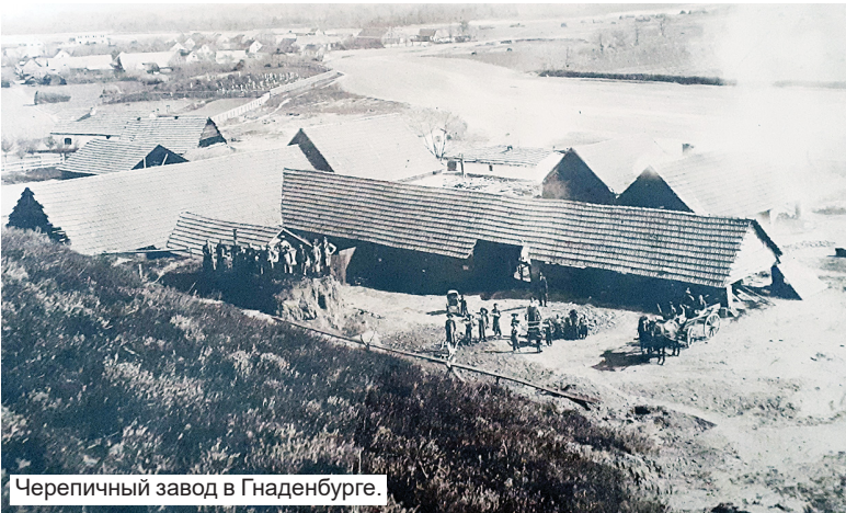
Черепичный завод в Гнаденбурге.

В 1882 году в колонии Гнаденбург проживали уже 52 семьи. С 1892 года началось строительство церкви с колокольной, школьного дома и детского сада, а также